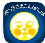
『おつきさまこんばんは』 林 明子 作

静かな夜の空にお月さまが出てきました。「おつきさまこんばんは」。ところがそこに雲さんがやってきて…。「まんまるおつきさま」の優しい表情に、うめ組さんも思わずにっこりです。